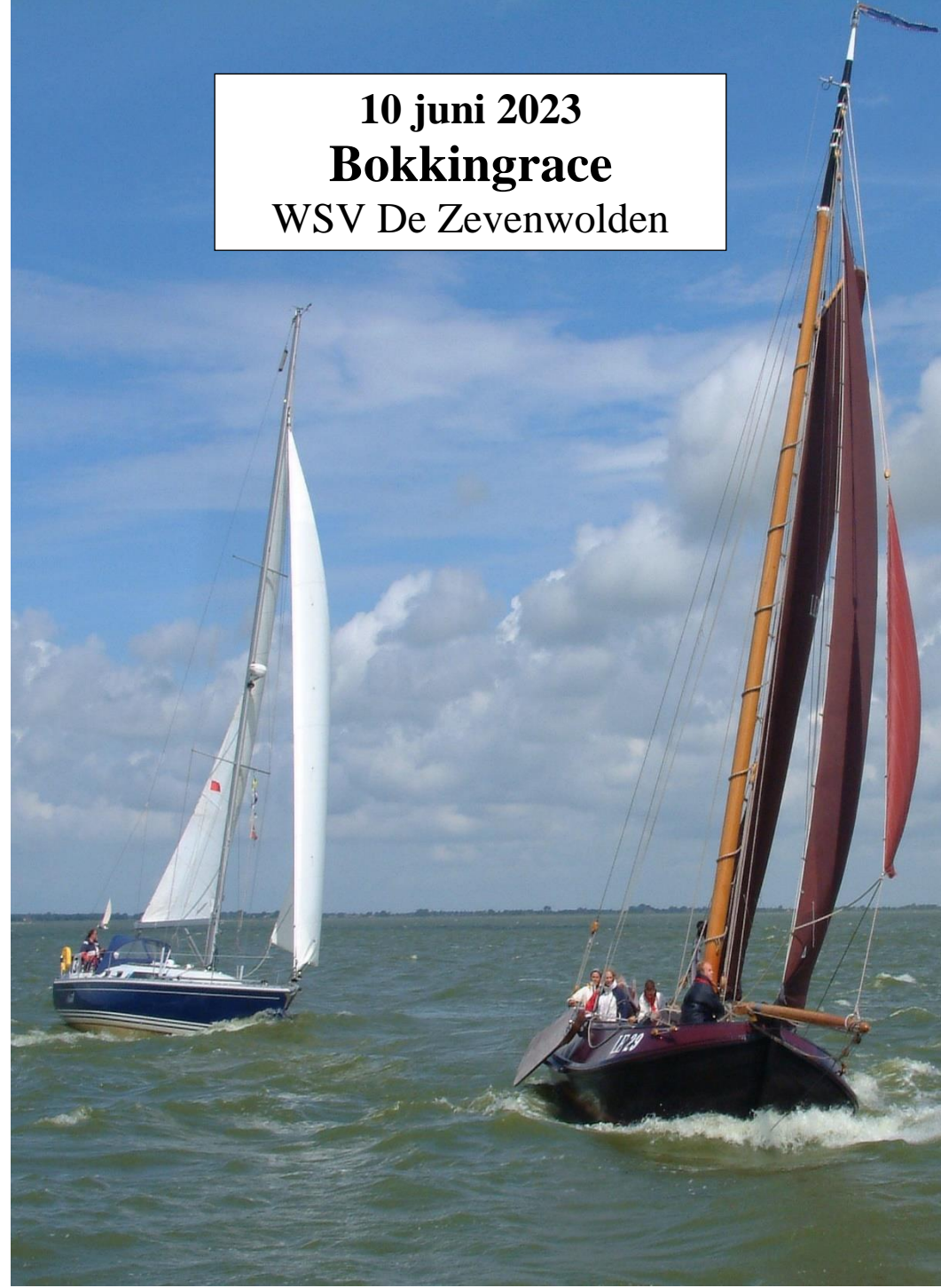
10 juni 2023 Bokkingrace WSV De Zevenwolden